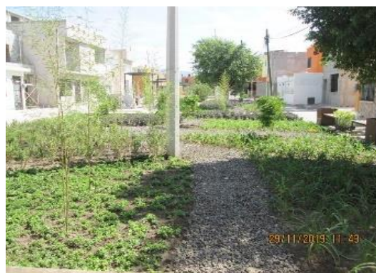
Ver Carpeta G. Unidad Habitacional "El Higuierón"