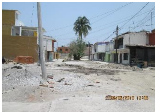
Apariencia al Término de la Obra