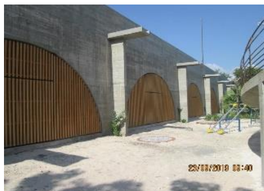
Ver Carpeta E. Escuela Emiliano Zapata