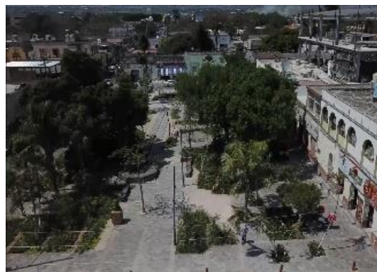
Ver Carpeta C. Zócalo y Jardín Municipal