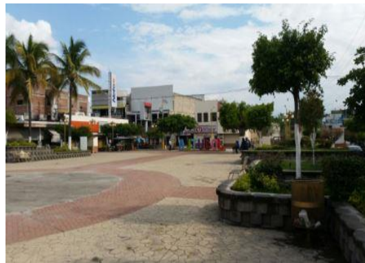
Apariencia al Término de la Obra